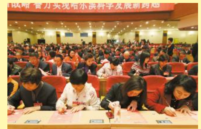
——哈尔滨市十四届人大一次会议剪影